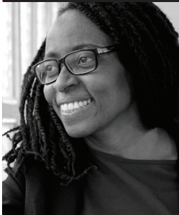
Rita Bosaho Gori

Diputada de Ahora Podemos en el Congreso (Alicante) Licenciada en Historia